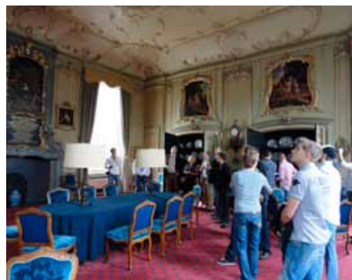
De regentenkamer van de Fundatie van Renswoude

De groep wordt ontvangen in het stationsgebouw van het Spoorwegmuseum dat in 2000 geheel is teruggebracht in oude stijl. Onder het genot van een kopje koffie krijgen de leerlingen uitleg van de architect die de restauratie heeft geleid. Hierna begeeft de groep zich naar de Fundatie van Renswoude. Dit gebouw is in 1756 gebouwd en was bestemd om de meest begaafde jongens uit het kindertehuis op te leiden voor beroepen van kunstschilder tot arts. In het pand zijn prachtige schilderwerken en ook divers stucwerk te bezichtigen, waarbij het rococostucwerk in de regentenkamer het meest opvallend is.