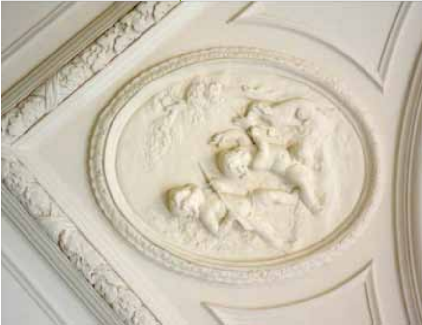
Een historisch ornament