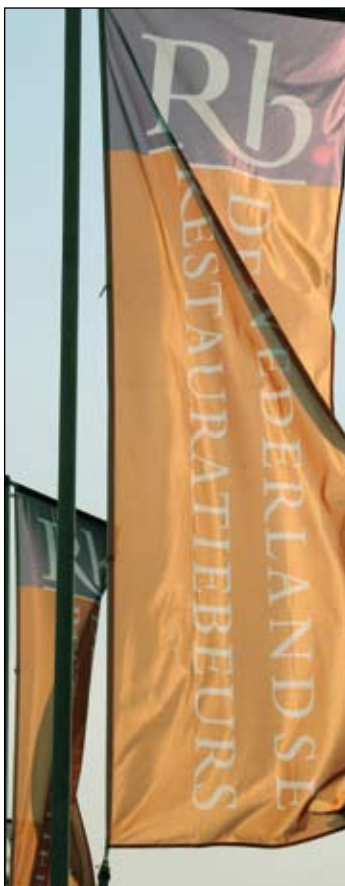
Oranjepaarse vlaggen markeren het pad naar de Branbanthallen