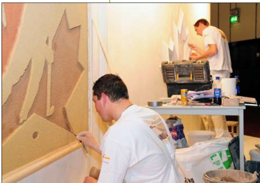
Restauratiestukadoorswerk is echt een bijzonder vak

Informatie over opleidingen in de afbouw is te vinden op www.devakopleiding.nl .