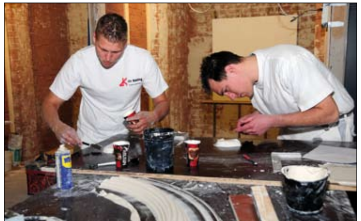
Alle aspecten van de opleiding komen in de opdracht terug

“Het is de bedoeling dat de kandidaten alle technieken gebruiken die ze hebben geleerd”, vervolgt Piet. “Bovendien mag je van een aankomende meesterrestauratiestukadoor verwachten dat hij zelf nieuwe oplossingen bedenkt. In de opleiding hebben ze ook kennis opgedaan van klassieke bouwkunst, fresco’s, stucmarmor, enzovoorts. Een restauratiestukadoor hoeft niet per se alles zelf te kunnen, maar hij moet wel weten waar hij het kan halen. Het vorige werkstuk,