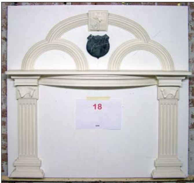
Het resultaat van zes dagen hard werken

u aan de slag kunt. Van u wordt een actieve inbreng verwacht tijdens de discussies, presentaties en het uitwerken van de praktijkopdrachten.