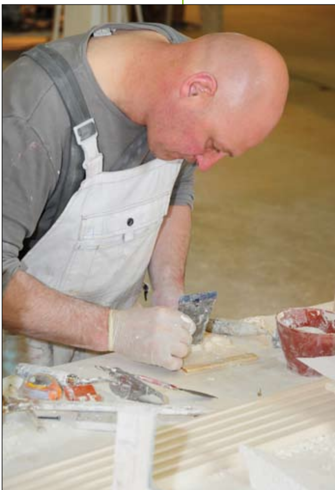
Er wordt hard en geconcentreerd gewerkt

Van twaalf tot één hebben de kandidaten verplicht pauze. Ondanks wat er op het spel staat, ogen de meesten ontspannen. “Je