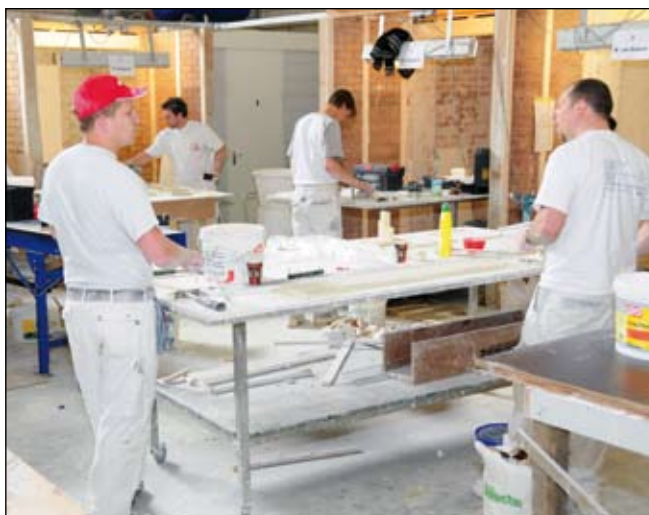
Het examen vindt plaats in het NOA Vakcentrum

brengen tot uitvoerbare onderdelen. Dat is iets wat je moet leren. De stukadoors moeten van alles doen: boetseren, mallen maken, afgieten, lijsten trekken, pas zagen, onderdelen op de ondergrond plakken, enzovoorts. Een echte vakman weet van tevoren hoe dingen gaan lopen. Hij is in staat om binnen de vastgestelde tijd een werkstuk neer te zetten met een kwaliteit die voldoende is om te verkopen. Maar let op: de examenopdracht kan er nog zo prachtig uitzien – als de afmetingen niet kloppen, hebben we samen een probleem. De toleranties zijn miniem. Een afwijking van één