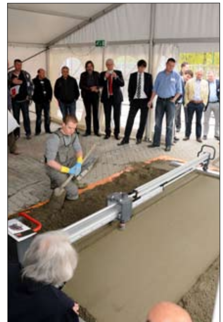
Belangstelling voor de mechanische vloerenrei

Veel belangstelling is er voor de demonstratie van een mechanische vloerenrei door Omtzigt Bouwmaterialen. De Italiaanse innovatie moet garant staan voor constante kwaliteit en goede productie. Sowiezo sluit zij prima aan op de actuele discussies over arbeidsomstandigheden. In dat kader past ook de folder met de afspraken over de toekomst van zandcementdekvloeren, die de NOA heel